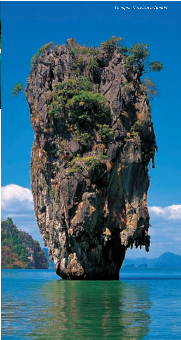
Остров Джеймса Бонда

Расположенные в Андаманском море в трех часах пути от материка, девять островов архипелага Симилян совсем не похожи на острова залива Ао Пханг-нга. Архипелаг Симилян состоит из удивительных и по-своему прекрасных гранитных островов, а не из известковых пород. Помимо пешеходных троп и красивейшего