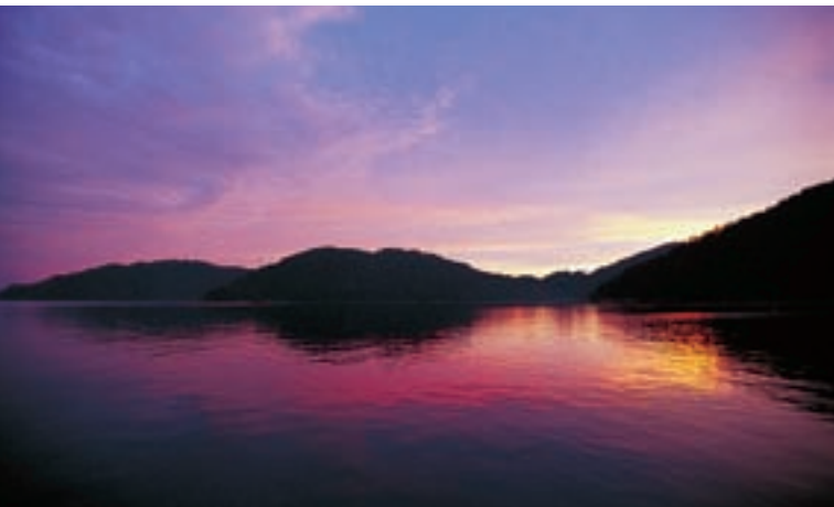
Архипелаг Му Ко Сурин

побережья, острова славятся множеством (более 30-ти) мест для погружения под воду, каждое из которых отличается разнообразными и необычными красотами природы: коралловыми рифами, гигантскими морскими веерами (горгони), морскими губками, скалистыми рифами с многочисленными проходами и пещерами. Небольшие глубины этих мест позволяют не только погружаться с аквалангом, но также плавать с маской и трубкой.