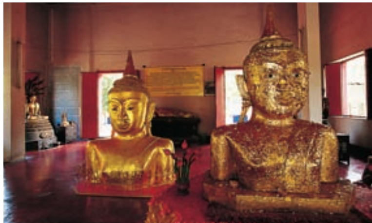
Ват Пхра Тхонг

Музей расположен неподалеку от памятника двум героиням, здесь