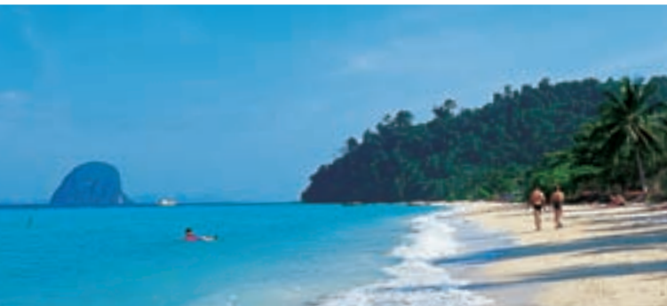
Остров Ко Нгай