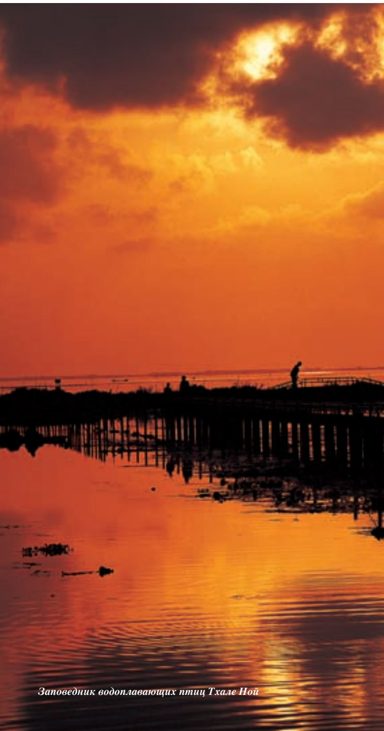
Заповедник водоплавающих птиц Тхале Ной

в целях охраны тысяч видов водоплавающих птиц. Заповедник расположен в тамбоне (уезде) Тхале Ной, в 15 километрах от ампера Кхуан Кханун или в 32 километрах к северу от Пхаттхалунга. Туристы могут отправиться на лодочную экскурсию по заповеднику, чтобы наблюдать за водоплавающими птицами, которых здесь очень много в период с декабря по апрель. Каждое утро на озере распускается множество розоватых цветов лотоса. В деревне можно купить плетеные изделия из камыша местного производства.