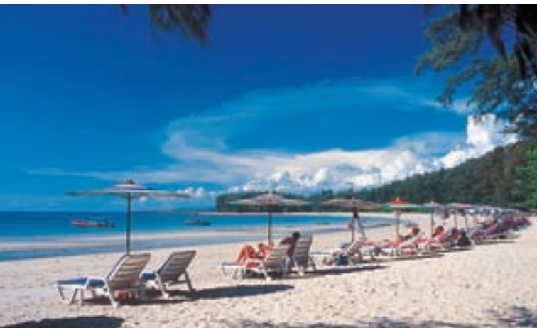
Пляж Хат Най Янг