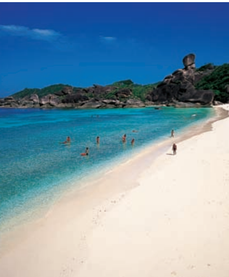
Один из островов архипелага Симилан