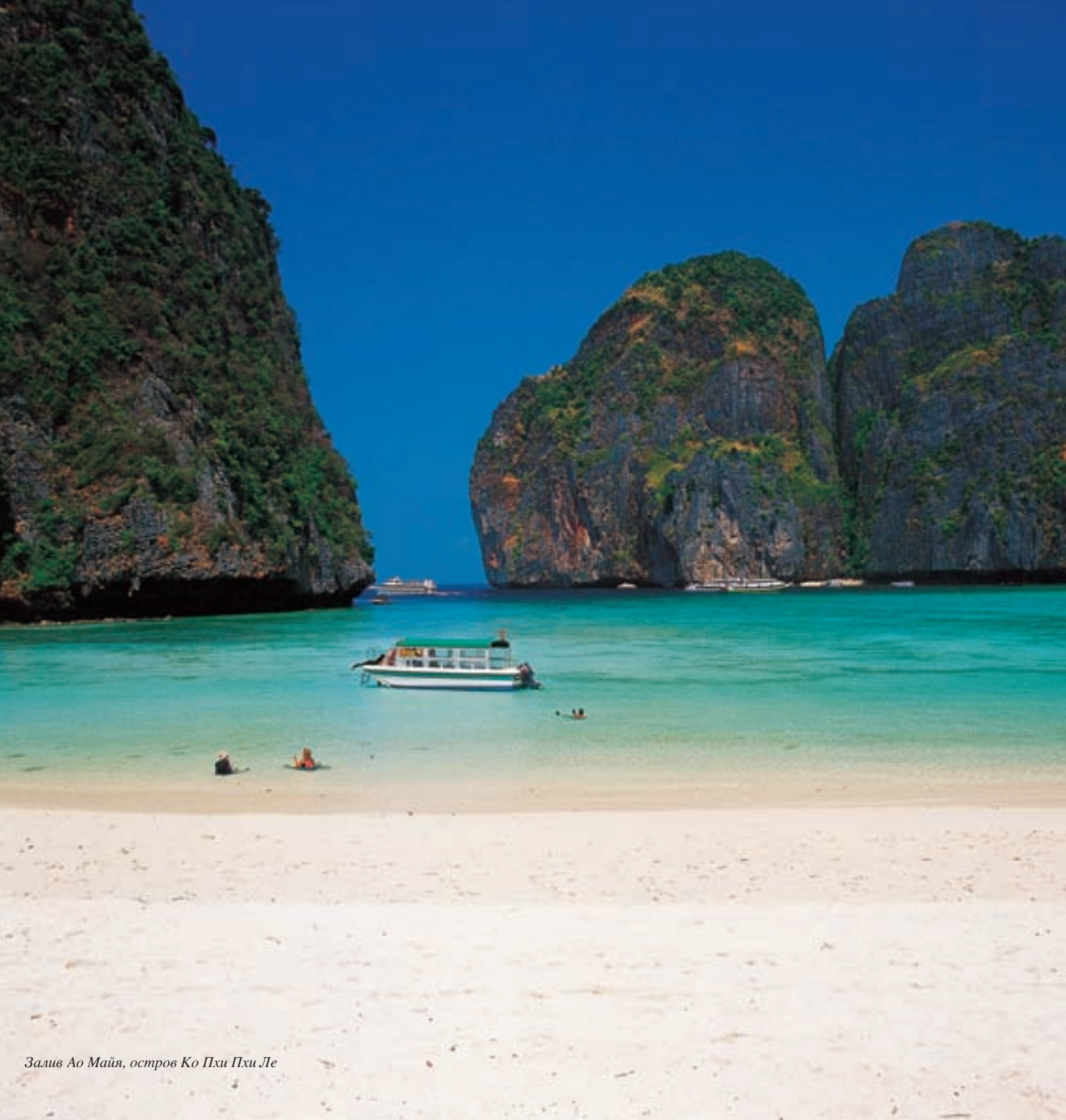
Залив Ао Майя, остров Ко Пхи Пхи Ле