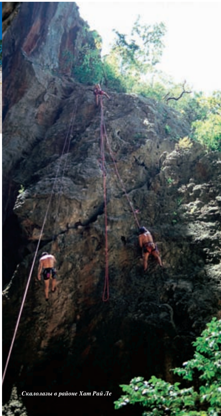
Скалолазы в районе Хат Рай Ле

Залив Ао Нанг находится в 6 км от Хат Ноппхарат Тхара, большой бухты с живописными пляжами и 83 островками.