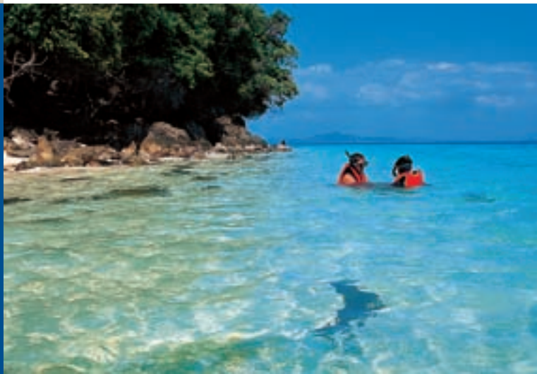
Остров Ко Крадан

Лучшее время года для путешествия в Транг с ноября по апрель, хотя здешние водопады наиболее полноводны в конце сезона дождей (в сентябре-октябре).