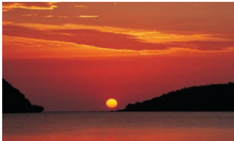
Закат в районе пляжа Хат Пак Менг

В этом заповеднике, расположенном в 20 километрах от города Транг, находятся два красивых водопада – Тон Йи и Тон Плио.