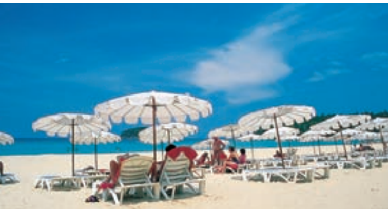
Пляж Хат Ката

На южной оконечности острова расположен Центр биологических исследований моря и Аквариум Пхукета.