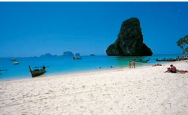
Залив Ао Нанг