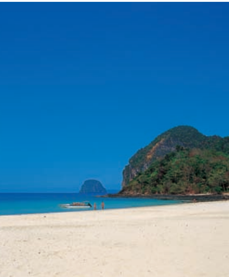
Остров Ко Мук