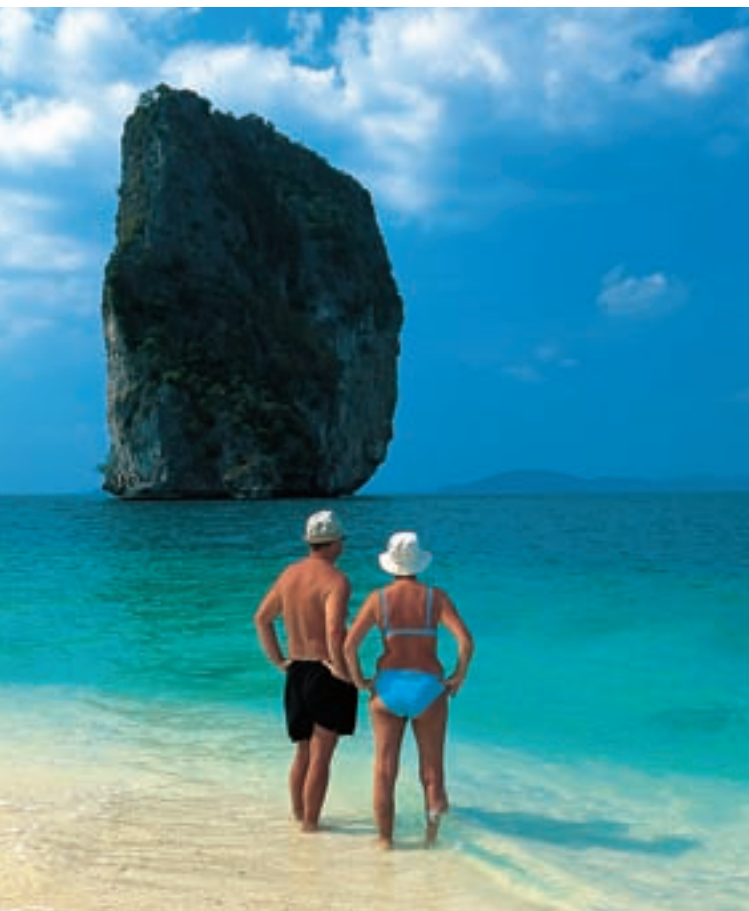
Остров Ко Пода