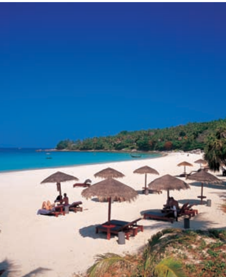
Пляж Хат Паиси