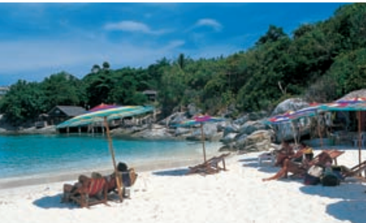
Остров Ко Рача

курсию на остров можно заказать у туроператоров. Туристы также могут поселиться на острове.