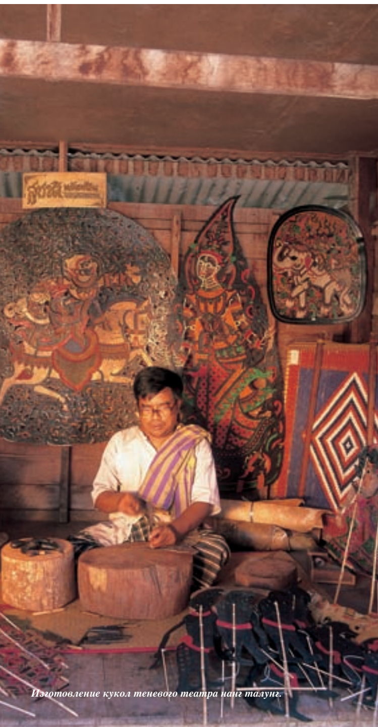
Изготовление кукол теневого театра нанг талунг.