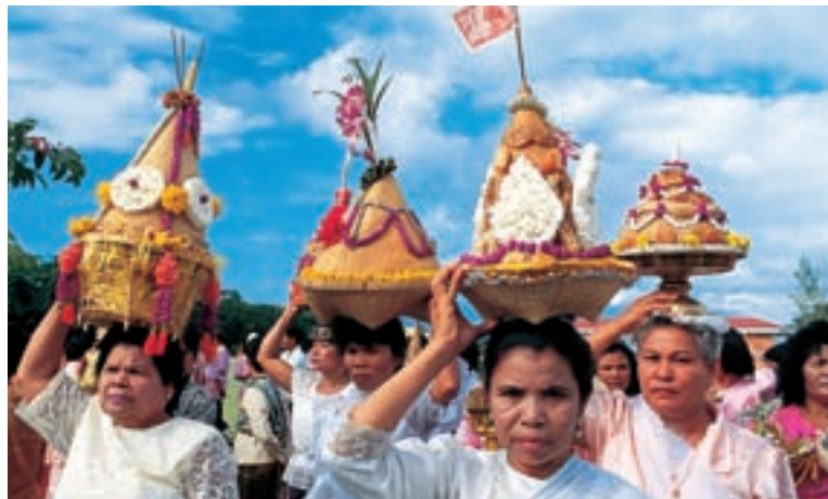
Праздник Десятого лунного месяца