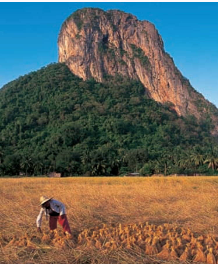
Гора Кхао Ок Тхалу