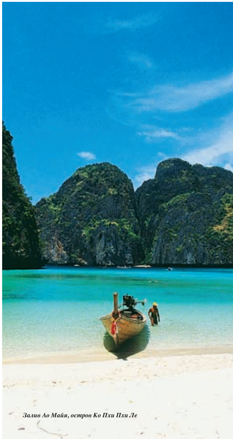
Залив Ао Майя, остров Ко Пхи Пхи Ле

Местные сувениры – это клетки для птиц, изготовленные из панциря черепахи. Кроме того, здесь часто покупают рыбную пасту для соуса, сушеную рыбу и креветки. Лучшие магазины расположены на улице Уттаракит.