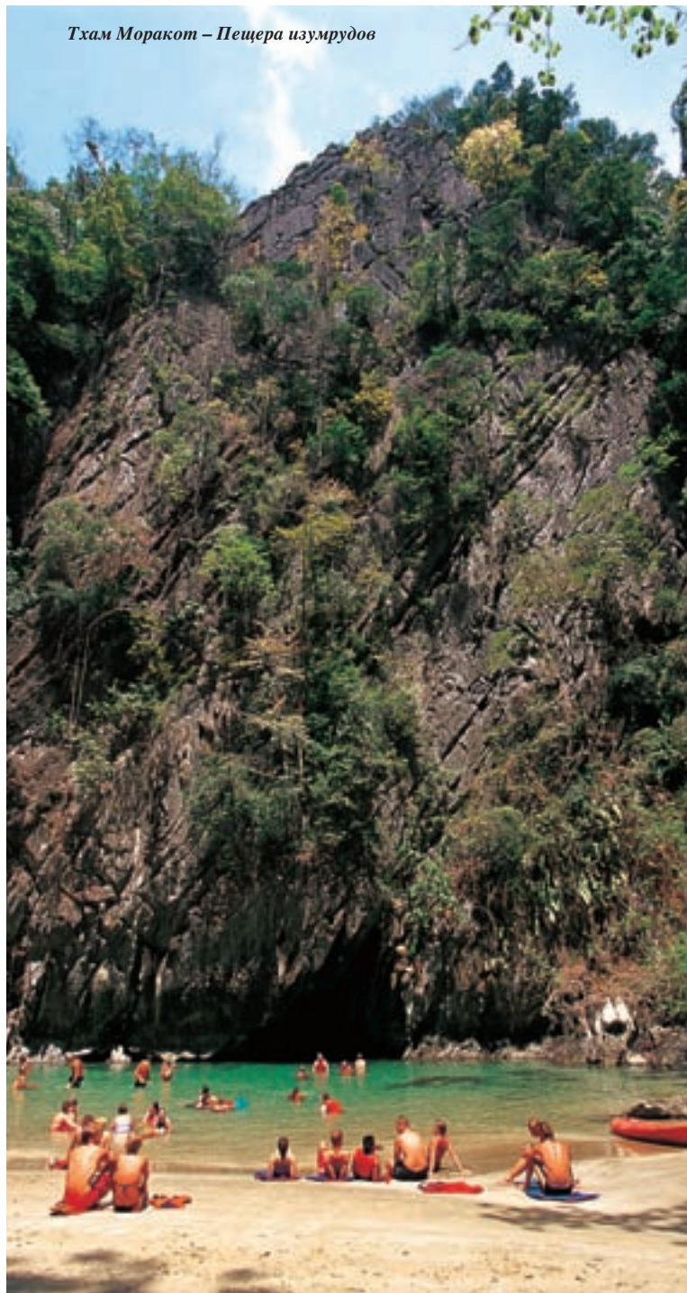
Тхам Моракот — Пещера изумрудов

Транг известен такими сувенирами, как яан липхао — сумками, которые производят из прочных и гибких стволов растущих в джунглях лиан, а также куклами традиционного театра теней нанг талунг.