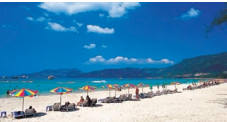
Пляж Хат Патонг

На этом живописном побережье расположены две удивительные пещеры, хотя водовороты могут быть небезопасны для пловцов.