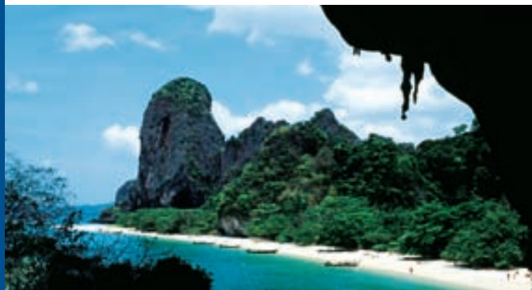
Пещера Пхра Нанг

Национальный парк Хат Ноппхарат Тхара- острова Пхи Пхи Территория Морского национального парка включает побережье в пределах города и острова, расположенные неподалеку. Среди разнообразных ландшафтов есть как окаймленные казуариновыми соснами пляжи Хат Ноппхарат Тхара, так и длинная песчаная полоса хорошо обустроенных пляжей залива Ао Нанг, архипелаг Пхи Пхи и Сусан Хой (Кладбище раковин), где около 40 миллионов лет тому назад остатки ископаемых раковин превратились в окаменелости.