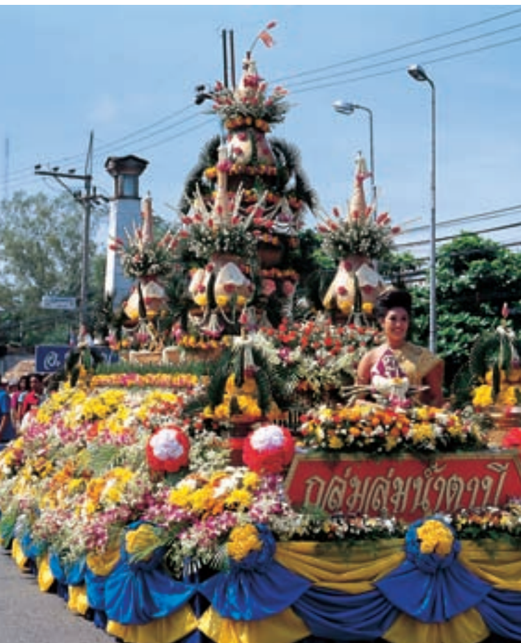
Праздник Десятого лунного месяца