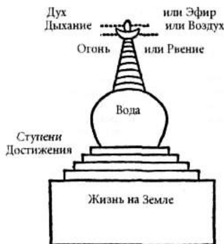
Символика тибетских чортемов.

Чортен — это полный символ нашей веры. Мы рождаемся на земле. В течение всей жизни мы взбираемся или пытаемся взобраться как можно выше по Ступеням Достижения. Наконец, испустив последний вздох, мы входим в царство Эфира, или Духа. Затем вновь рождаемся для получения нового урока. Колесо Жизни символизирует этот бесконечный цикл: рождение — жизнь — смерть — дух — рождение и т. д.